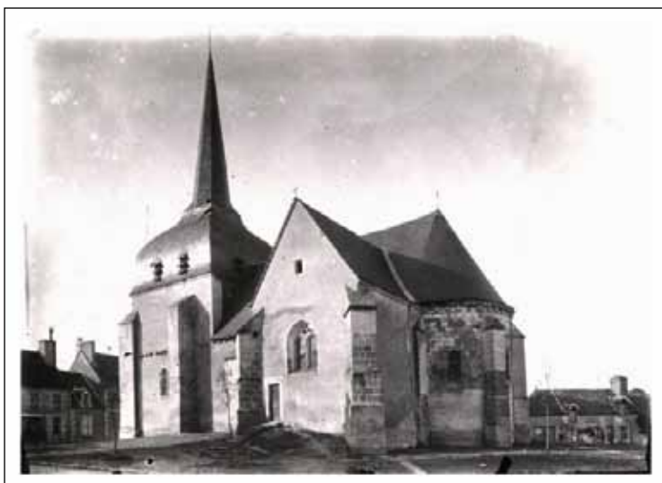
Poulaines, église : chevet et bas-côté sud (début XX e siècle)

Toutefois, avant d'embarquer sur un vaisseau temporel et de remonter aux origines de Poulaines, une présentation succincte de cette commune au XXI e siècle s'impose.